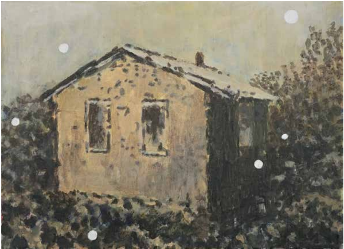
sommerfest und abgelegen, 2018